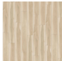
Blonde Maple RVISELPBLON