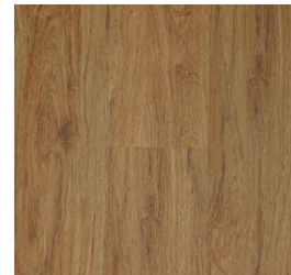
Natural Hickory RVI0876MATCHMATE