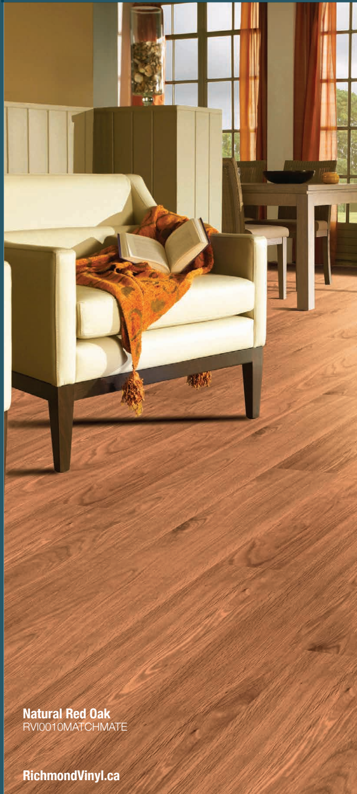
Natural Red Oak RVI0010MATCHMATE