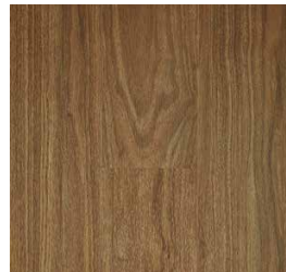
English Walnut RVI0066MATCHMATE