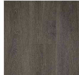
Carbon Oak RVI0614MATCHMATE