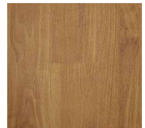
Natural Red Oak RVI0010MATCHMATE