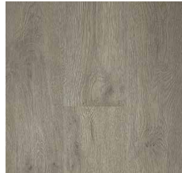
Saaniche Oak RVI0610MATCHMATE